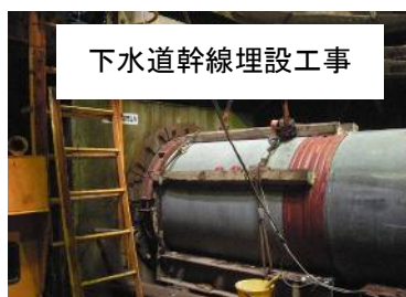
下水道幹線埋設工事

下水道部長は、4年スパンで収支の均衡を図り管理しているが、企業会計に則った経営管理に基づかないと、独立採算原則の説明は難しいと答えました。